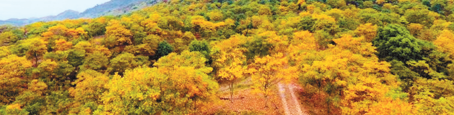
独山公司拥有无患子林地12万多亩，且多为自然生长林。