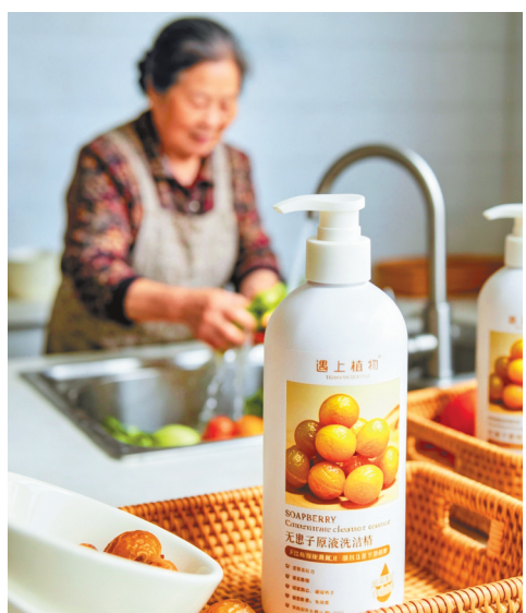
“遇上植物”开发的无患子原液洗洁精很受市场欢迎。

原液，价值将提升8倍以上。目前，该公司正延伸切入美妆护肤、生物医药等高附加值赛道，全产业链价值有望放大20至50倍，