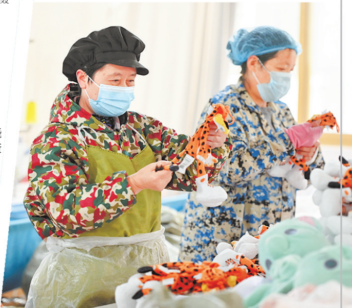
在松桃经济开发区松桃积玩玩具公司，务工群众在生产玩具。