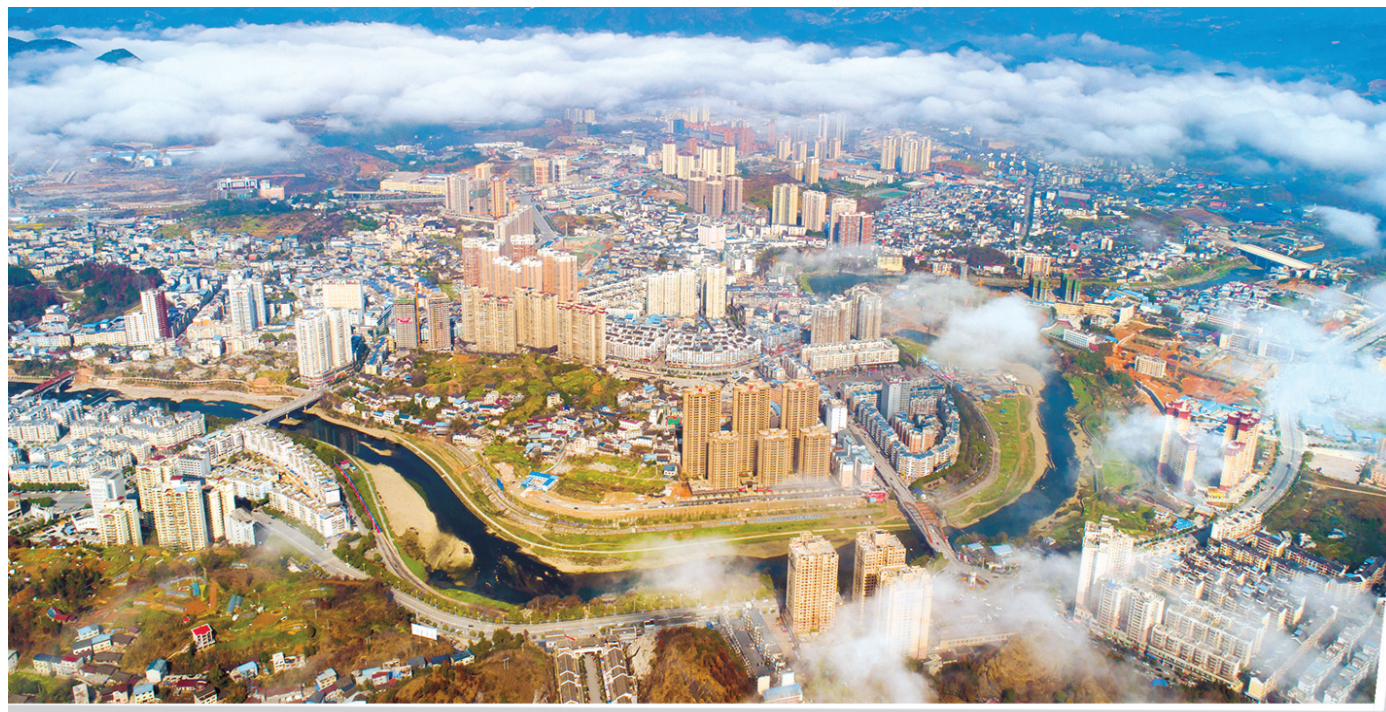
松桃县城山水环绕。

坚持以富民为根本，奋力推动共同富裕迈上新台阶。始终把造福人民作为根本价值取向，努力让改革发展成果更多更公平惠及全县人民。一是大力发展乡村富民产业。坚持特色化、差异化、品牌化，大力抓好茶叶、花生、辣椒、优质水稻、鲜食玉米等订单农业，进一步把特色优质农产品挖掘好、认证好、宣传好，力促农业增效、群众增收。二是深化文旅融合发展。大力挖掘松桃红色文化、民族文化和历史文化，擦亮英雄故里文化品牌，推动以文塑旅、以旅彰文。主动融入梵净山生态旅游经济圈，致力打造梵净山世界级旅游景区北部门户与自然亲子度假旅游基地。三是扎实推进乡村全面振兴。学习运用“千万工程”经验，以产业振兴为核心，抓实“两清两改两治理”，加快“五好两宜”和美乡村试点，有序推进乡村全面振兴。