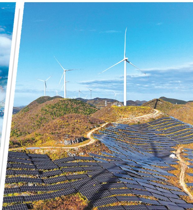
松桃自治县盘石镇风电项目和光伏项目。