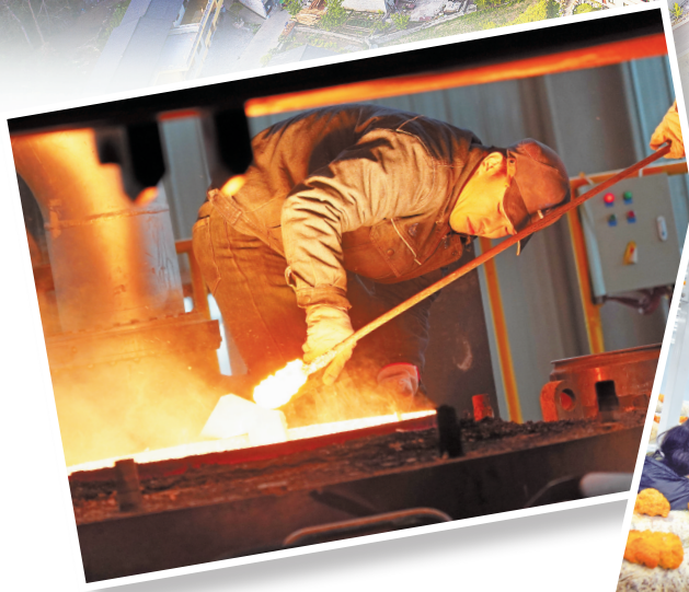
↑贵州连威宇航合金材料有限公司炼制的钢材即将出炉。