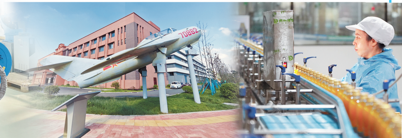
安顺航空配套制造产业园一角。