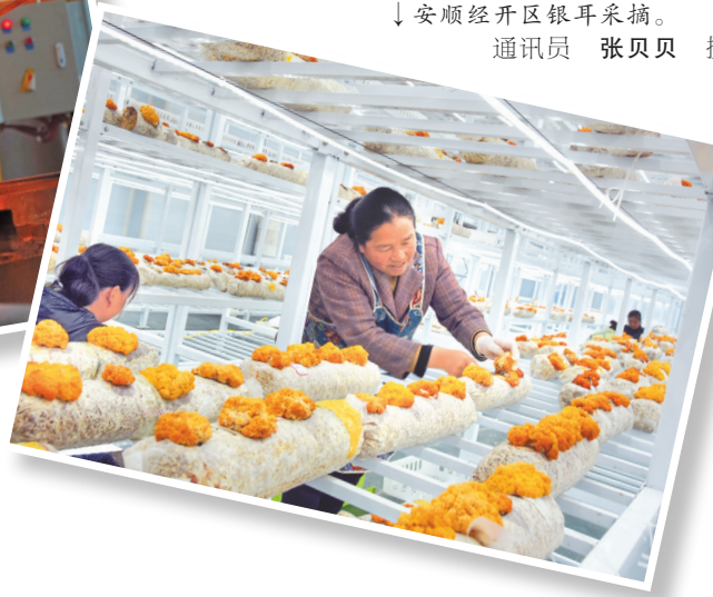
↓安顺经开区银耳采摘。