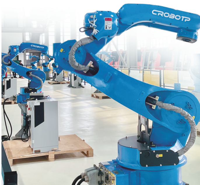
贵州盛航云集科技有限公司的智能化生产车间。

这是安顺经开区积极探索智慧政务、推动服务模式创新的一个生动缩影。陈晓婵表示，中心将认真总结“云勘验”经验，不断完善流程、扩大应用范围，让更多企业和群众享受到数字化改革带来的红利，打造让人民满意、让企业舒心的营商环境。