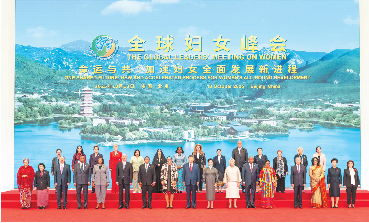
10月13日上午，国家主席习近平在北京国家会议中心出席全球妇女峰会开幕式并发表主旨讲话。这是习近平和夫人彭丽媛同与会各国和国际组织代表团团长夫妇合影留念。