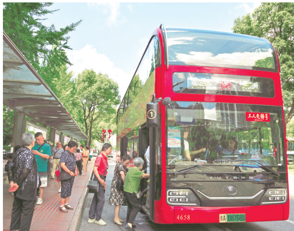
7月15日，在贵阳市1路公交车站，人们有序乘上一辆双层新能源公交车。目前，贵阳市新能源、清洁能源公交车占比达99.9%，全市公共交通迈入绿色低碳时代。

数据显示，2024年，三穗鸭产业综合产值达14亿元。目前，三穗县有涉鸭企业44家，标准化养殖场8个，规模肉鸭养殖场47个、散养1万余户，存栏蛋鸭80万羽，日产蛋72万枚左右，当地正奋力推动全产业链再上新台阶。