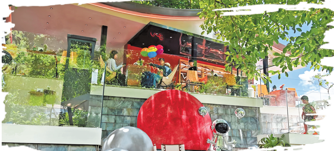
咖啡馆里，游客享受悠闲时光。