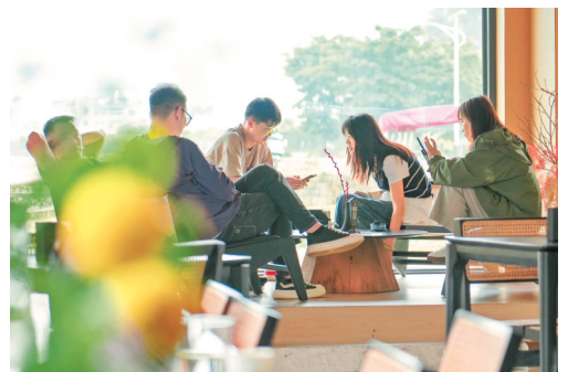
万峰林下的咖啡馆中，游客在等待咖啡饮品。

漫步兴义市区，以火车为主题的“山·站”，以热带植物为主题的“屿浪”，以藏品为主题的“古仓”……一店一景，一杯一味，各有各的调性。这样的咖啡馆，在万峰林景区和兴义城区随处可见，已然成了这座城市独特的消费风景线。