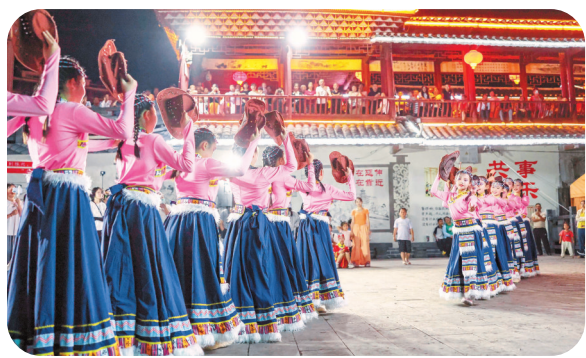
群众在风雨桥边载歌载舞。

近年来，玉屏各族人民以铸牢中华民族共同体意识为主线，将民族团结进步事业融入经济社会发展的血脉之中，奋力谱写各民族共同团结奋斗、共同繁荣发展的时代篇章。