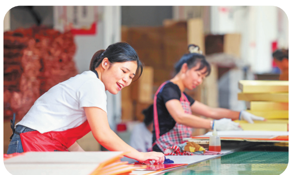
搬迁群众在康华社区一家微工厂里忙碌。