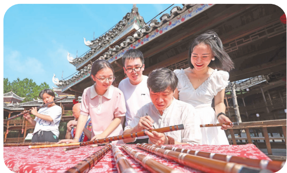
游客在侗乡风情园景区观看传承人制作箫笛。