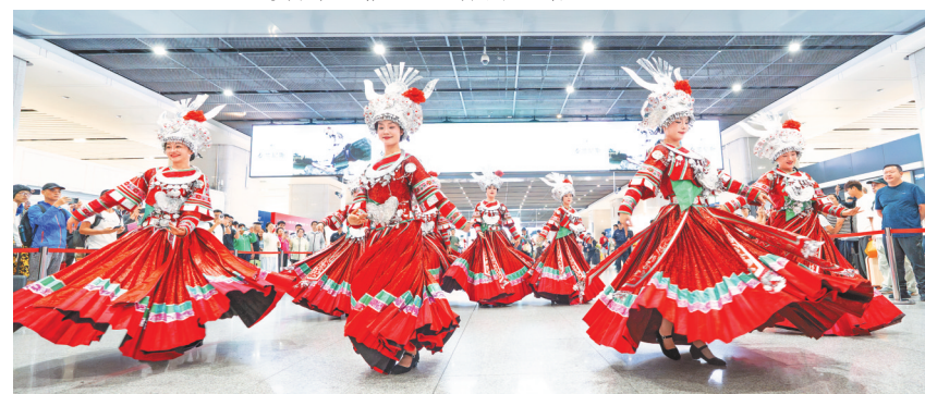
6月13日，深圳北至贵阳北G2946次、成都南至贵阳北G5357次两趟“贵马专列”顺利抵达贵阳北站，主办方用热情的舞队迎接参赛者。

老韩掰着指数，前不久中国U-23国家队在奥体对阵塔吉克斯坦，隔两天贵马又开跑，25000名跑者涌进观山湖。“那几天从早跑到晚，乘客全是外地口音，上车就问哪家肠旺面地道、哪家精酿好喝，我现在都成兼职导游了。”