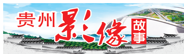
“城市摆渡人”系列报道之一