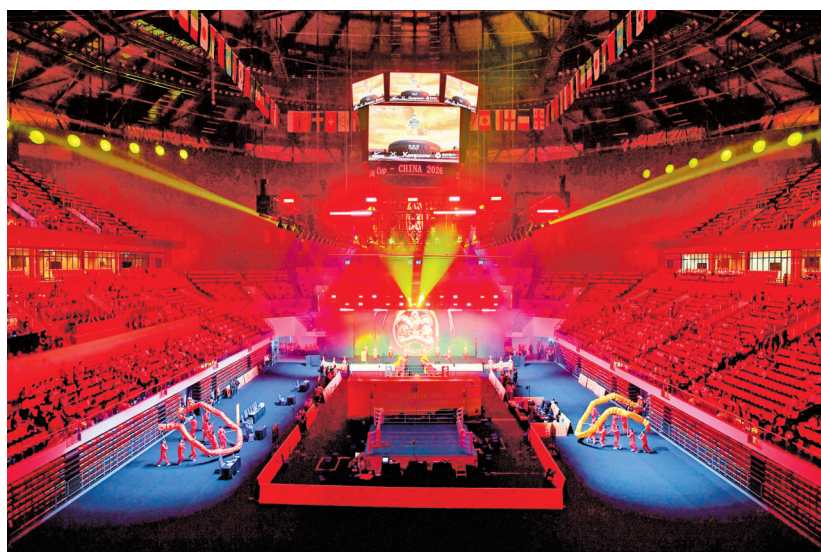
6月15日晚，2026世界拳联世界杯中国站在贵阳市观山湖区贵阳体育馆开幕，这是该项赛事首次落户中国。本次赛事吸引了全球40个国家和地区的代表队，共299名运动员参加，中国国家队派出20名运动员参赛。比赛设置男女共20个重量级别，涵盖全部奥运级别。图为开幕式现场。

红渡村党支部还创新探索“村播+”模式，通过在直播等候区开展政策宣讲、文明实践、便民服务、纠纷调解等便民服务延伸“村播”功能。同时，红渡村将“村播”向全镇、全县村（社区）延伸覆盖，推行“巡回直播”模式，目前累计开播265场，销售6.1万单，总销售额达145.89万元。“近期我们正在开展电商运营等专题实训，希望将更多普通村民变为‘带货达人’，让‘村播’可持续，进一步带动村民增收致富。”徐毅说。