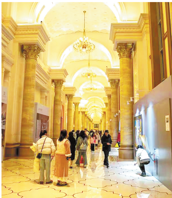
游客在花果园艺术中心参观。

在消费场景拓展上，花果园艺术中心四层汇集高端餐饮、法式下午茶、威士忌酒吧及多功能演艺厅，可承载相声、脱口秀、音乐会等多元文艺活动；顶层规划15万平方米空中草坪，适配品牌发布、高端车展、时尚大秀及露营市集等户外场景，实现室内外联动、文旅融合发展。