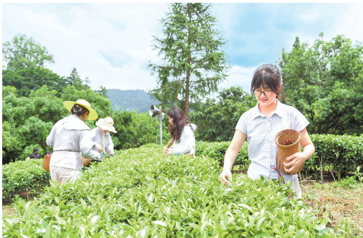
游客在从江县两妹镇长寨村生态茶园体验采茶。

6月6日，微风拂过贵阳市修文县六屯镇大木村，带来阵阵浓郁的咖啡醇香。顺着香气寻去，只见一座近期新开业的“穹岛·天坑咖啡”正成为无数游客争相打卡的网红地标。