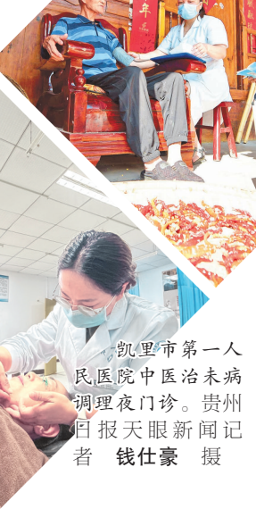
黔东南州锦屏县人民医院开展家庭医生上门服务。