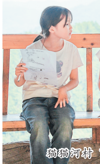
猫猫河村“少年诗班”的孩子朗诵自己写的诗。