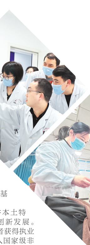
黔东南州锦屏县人民医院开展家庭医生上门服务。

站在“十五五”新起点，黔东南州将继续下沉优质医疗资源、培育基层医疗人才，让群众在家门口实现放心看病、安心就医，让健康民生福祉持续落地生根。