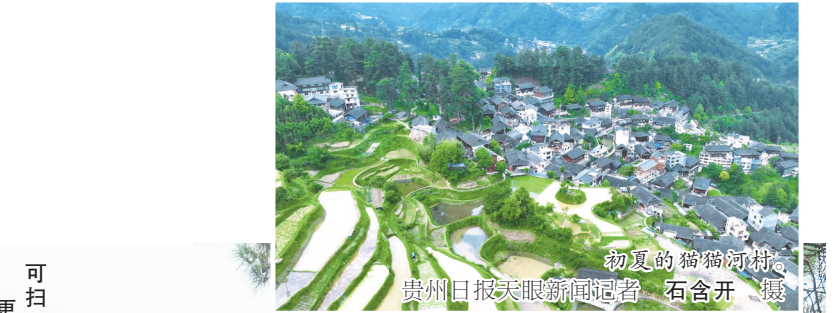
初夏的猫猫河村。