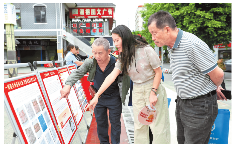
6月9日是第19个国际档案日，黔东南州榕江县档案局联合县档案馆在红军广场开展“档案与时代同行”主题宣传活动。图为群众观看档案宣传展板。

煤炭产业是六盘水的支柱产业之一。伴随着煤矿开采，全市每年约产生1500万吨煤矸石。由于煤矸石热值较低，资源价值难以转化，过去多半以堆放处理为主。近年来，六盘水市积极探索煤矸石资源化利用新路径，先后建起盘北、盘南等多个低热值煤发电项目，同时大力推进煤矸石充填沟道地试点项目建设，让低热值煤有了释放价值的新场景，填补了煤矸石等固废消纳缺口。