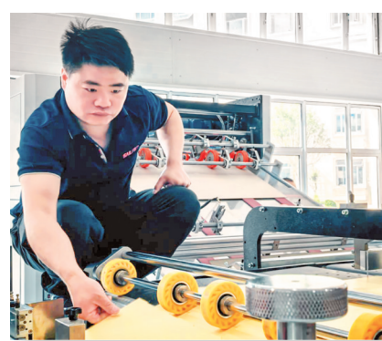
仁怀佰胜包装有限公司工作人员正在进行调试生产作业。