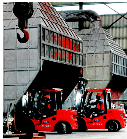
贵州鑫智鹏新材料有限公司工人在熔铸车间忙碌作业。

铝业强，鑫智鹏深耕高端铝材细分赛道，搭建起全流程精细化技术体系。依托领先的再生铝精深加工技术，鑫智鹏激活本地循环产业微循环。废旧铝材经智能破碎、气流分选等多道精细工序，实现杂质全方位剥离、原料高精度提纯，成品品质