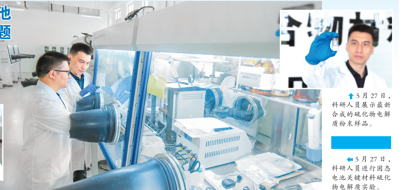
5月27日，科研人员展示最新合成的硫化物电解质粉末样品。