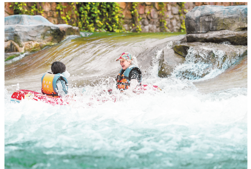
5月24日，黔东南州施秉杉木河漂流开门迎客。今年，施秉县整合全县优质文旅资源，串联云台山自然风光、杉木河漂流、白沙井沉浸式夜游等多元业态，极大丰富了夏季旅游产品供给体系，构建“白天纵情山水、夜间乐享烟火”的全新游玩模式。

以“安全生产月”为契机，贵阳贵安将纵深推进治本攻坚三年行动，扎实开展中央考核巡查问题整改“回头看”，全面排查景区、网红打卡点及户外运动项目等新兴风险。针对入汛以来的复杂形势，严格落实四级防汛责任和24小时值班值守，加密预警推送频次，确保预警直达到户、落实到人，高效处置险情。同时，统筹做好高考期间校园及周边安全保障工作，以高水平安全护航贵阳贵安高质量发展。