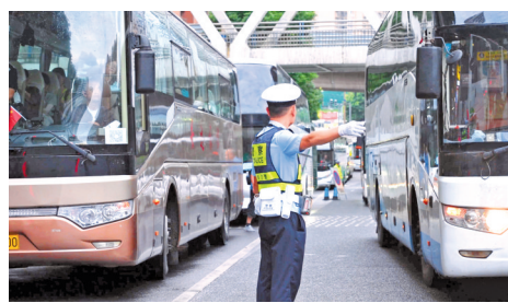
在贵阳市南明区花果园游客集散中心，民警穿梭在旅游大巴之间指挥交通，叮嘱司机行车注意事项。

交通治理，不只是秩序整顿、疏堵保畅的传统范畴，它是一场关于城市文明的精细对话。留住远方的车，也守住市民的安宁，让贵阳的烟火气更有温度、更有秩序。