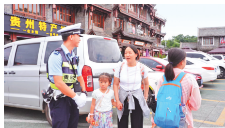
在花溪区青岩古镇，民警为游客服务。

【短评】盛夏将至，“爽爽贵阳”文旅热度持续攀升，车流人流交汇叠加，贵阳交警以精细化执法、人性化施策破解拥堵难题，既当“疏导员”，又当“大管家”，在热闹烟火与静谧安居之间找平衡点，擦亮城市文明底色。