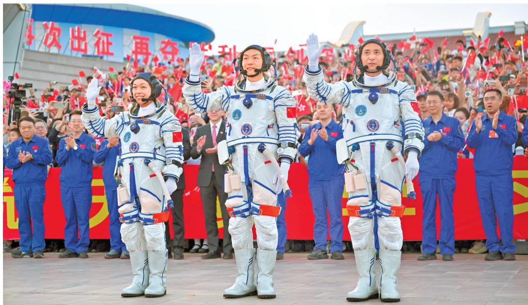
5月24日，神舟二十三号航天员乘组出征仪式在酒泉卫星发射中心问天阁圆梦园广场举行。