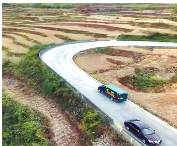
↑行驶在公路上的邮政车辆。