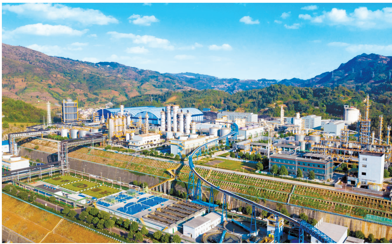
荣获国家级“绿色工厂”的贵州能源集团能源电投天能焦化公司。

在“十五五”开局之年，贵州能源集团紧扣国家能源强国战略与贵州省“富矿精开”战略，立足“十四五”发展坚实基础，以项目攻坚聚势，全面激活煤电、新能源、天然气协同发展新动能，奋力打造新型综合能源产业集群、西南煤炭保供中心和区域电力枢纽，在服务国家战略、赋能地方经济绿色转型中迈出铿锵步伐。