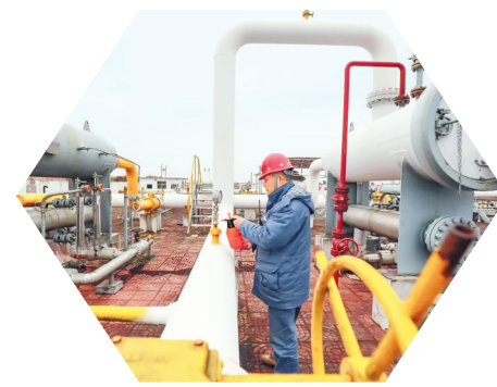
乌江能投旗下管网公司职工开展管网巡检。