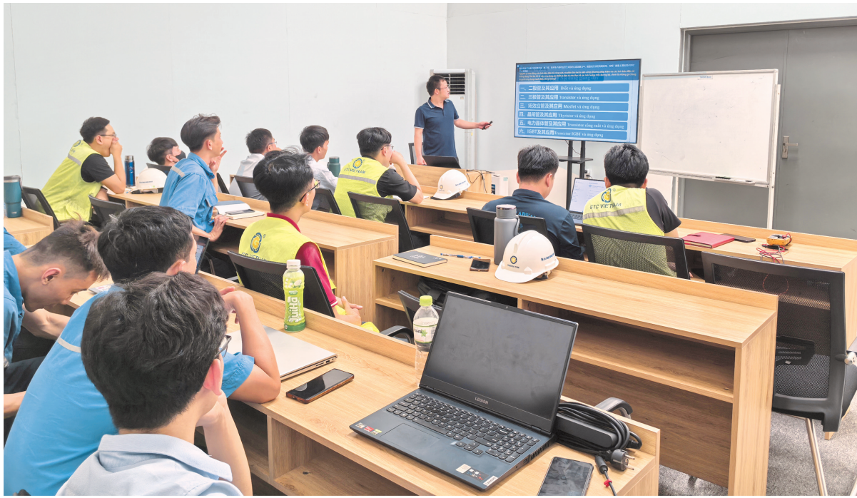
贵州轮胎股份有限公司越南工厂培训。