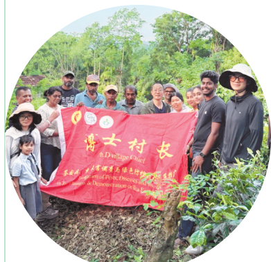
▲中国—斯里兰卡茶叶绿色防控技术“一带一路”联合实验室师生在斯里兰卡的茶园进行田间调查。

高等教育的国际化，不仅是知识的跨境流动，更是发展经验的共享与文明的对话。今天，我们聚焦贵州教育“走出去”的实践故事。 从斯里兰卡的翠绿茶园，到西班牙的阳光画室；从冈比亚的田间地头，到美国的汉语课堂——贵州大学已在海外设立4所孔子学院及汉语教学点，前沿科技与人文底蕴深度融合，在海外编织起交流网络。 贵州工业职业技术学院教师把课堂搬到越南工厂生产一线，为当地员工定制技能培训，破解贵州企业海外发展的本土化人才难题。这是贵州职业教育响应产业需求、伴随企业出海的务实之举。 两则案例共同勾勒出贵州教育深度融入“一带一路”建设的活力图景。