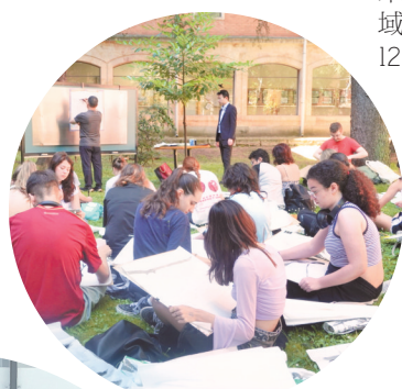
►西班牙萨拉曼卡大学孔子学院举办中国山水画课程。