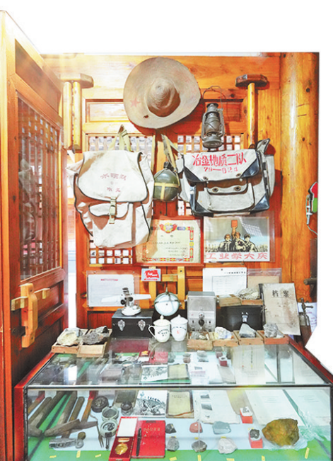
抱晖博物馆展品。