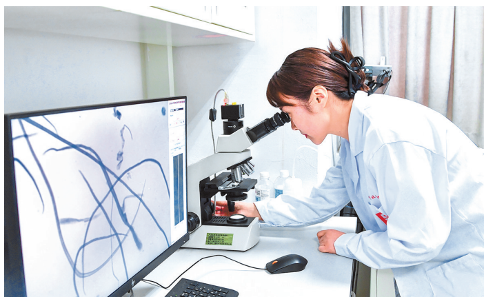
纸质文物修复组修复师进行纸张纤维原料分析。