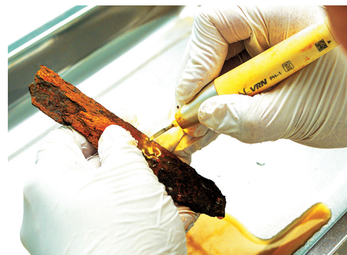
修复师在锈蚀的褶皱里，打捞时光的痕迹。