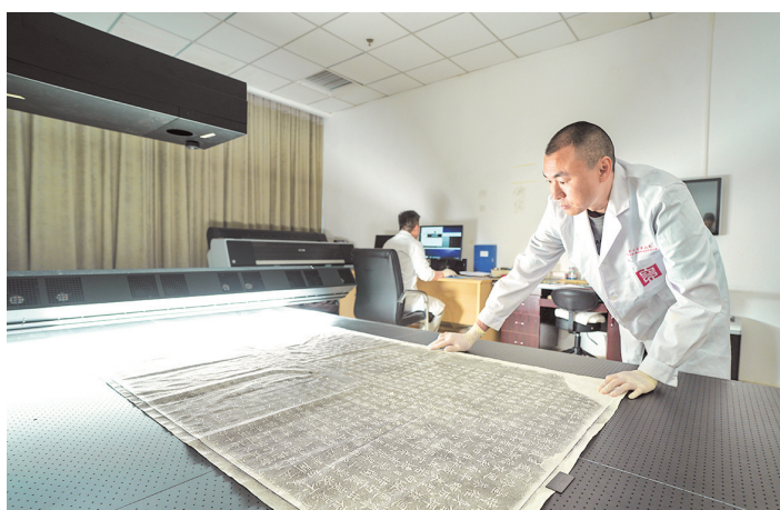
开展拓片高清扫描。