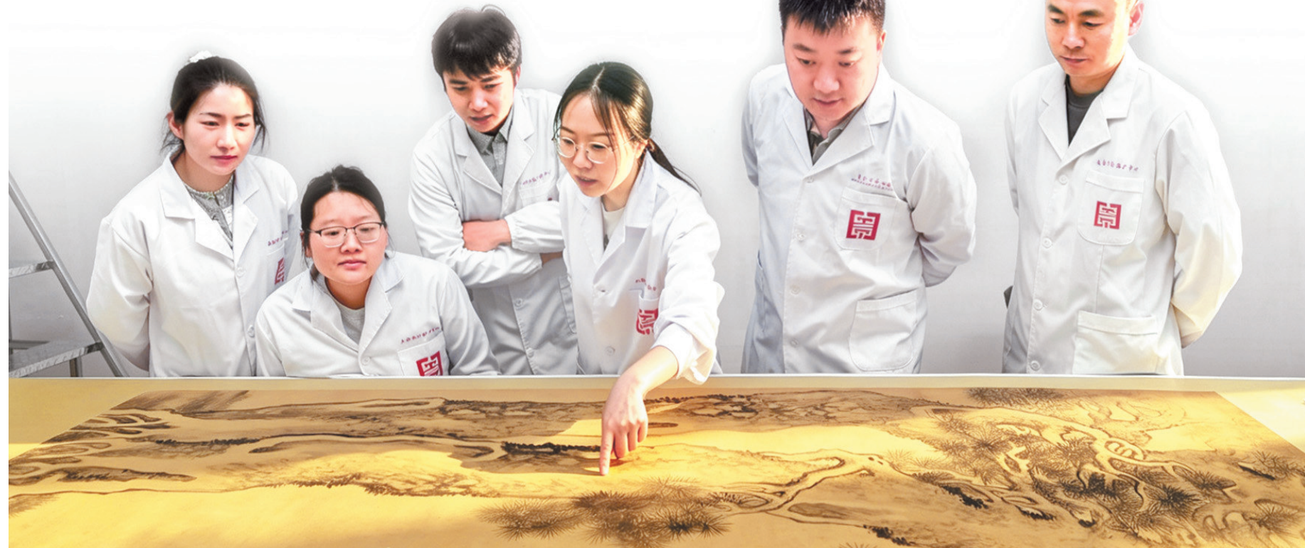
↓交流讨论文物保护修复。