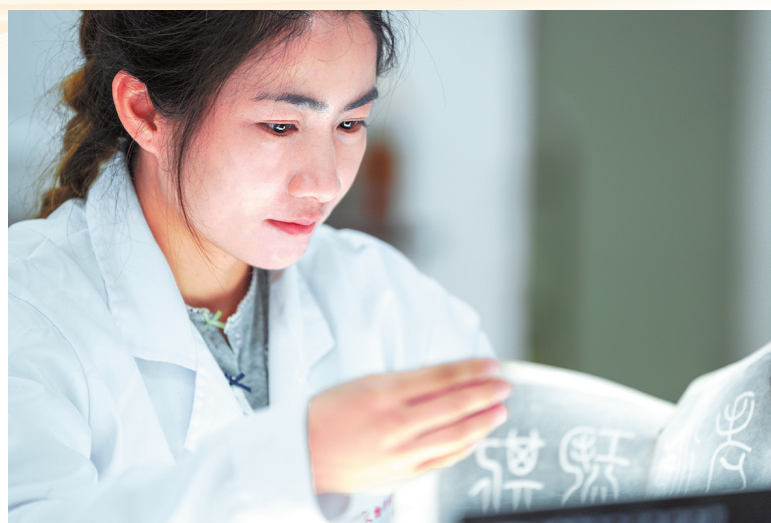
↑陶瓷文物修复组修复师进行瓷器的保护修复。