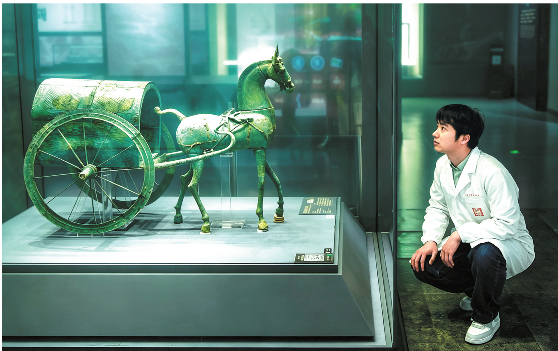
对望无声，却是修复师与文物之间独有的时空密语。