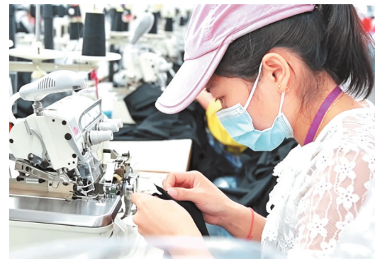
毕节市晶煌制衣有限公司工人在生产中。