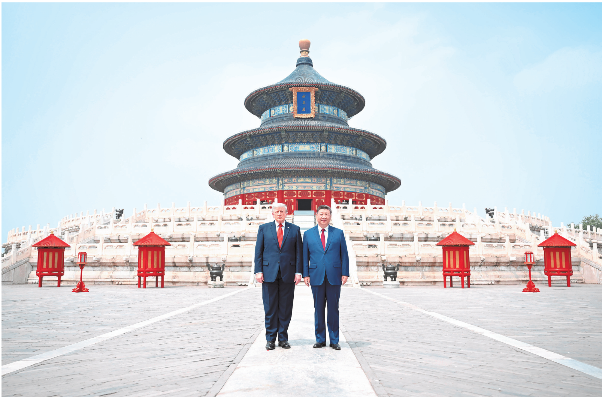
5月14日, 国家主席习近平同来华进行国事访问的美国总统特朗普参观天坛。两国元首在祈年殿广场合影。

特朗普表示, 当年的故宫之行至今记忆犹新。天坛历经600多年, 仍然巍峨屹立, 展现出中国精美的古典建筑艺术和博大精深的传统文化, 令人赞叹。美中两国都是伟大的国家, 两国人民都是伟大的人民, 富有智慧。两国应该深化相互理解, 增进人民友好。蔡奇、王毅、尹力等参加上述活动。