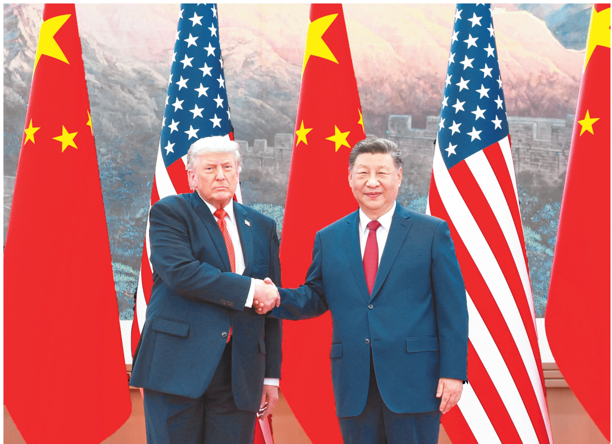
5月14日上午, 国家主席习近平在北京人民大会堂同来华进行国事访问的美国总统特朗普举行会谈。