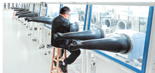
科研人员在贵州省固态电池关键材料与器件全省重点实验室进行电池测试。