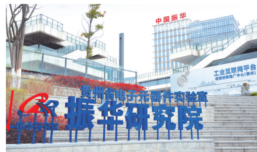
贵州省电子元器件实验室。