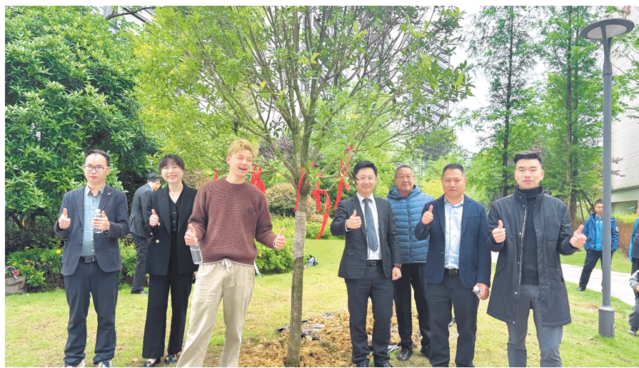
入驻仪式上，大家共栽“同心树”。