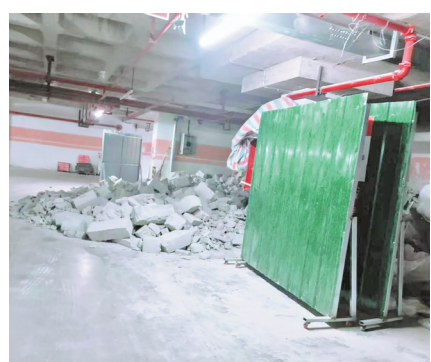
物业选聘期间，小区建筑垃圾未清理。