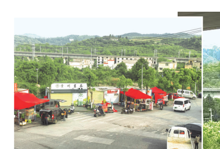
↑整改前人行道上的集装箱商铺。

关于“城管人员是否私收费用”，工作人员表示，经调查核实，针对三铺启顺快达物流园门口占道经营的集装箱，未发现金华镇综合执法队工作人员私自收取集