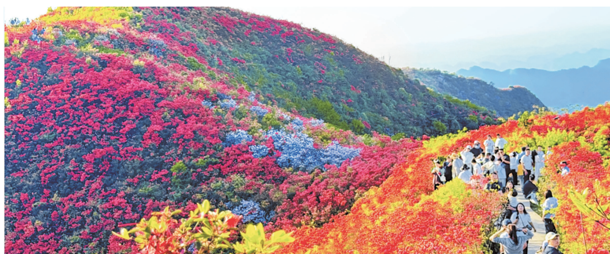
黔东南州丹寨县龙泉山杜鹃竞相绽放，引八方游客登高踏青。

象监测，强化应急值守，严格落实预警叫应机制，做好防汛抗旱应对，坚决遏制重大事故发生。要细化安全生产工作，深入排查整治交通、矿山、建筑施工、消防等领域风险隐患。要加强社会治安防控，切实维护人民群众生命财产安全和社会大局和谐稳定。贵阳市和省有关部门负责同志参加。