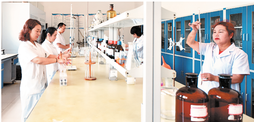
贵州重力科技环保股份有限公司产品实验室。

4月23日，行走在贵州重力科技环保股份有限公司的厂区道路上，下过微雨的园区中弥漫着淡淡青草香，道路两旁绿树成荫、繁花似锦，让人很难将这家企业与“含汞危废处置”联系起来。这家国家级专精特新“小巨人”企业，目前已手握19项发明专利、61项实用新型专利，构建了覆盖含汞危废无害化处置、资源化产品研发、工业废气净化的全链条技术“护城河”。……”