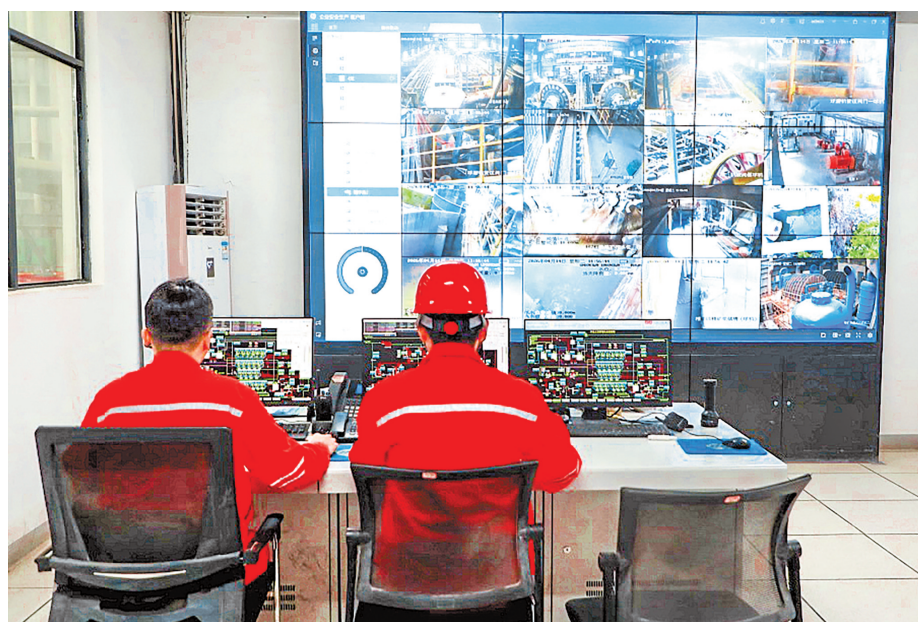
摩天冲磷矿选矿区总控室。

酯等，实现年产值1200亿元以上。当下，我们正锚定6月30日首批30万吨磷酸铁投产目标努力冲刺。……”