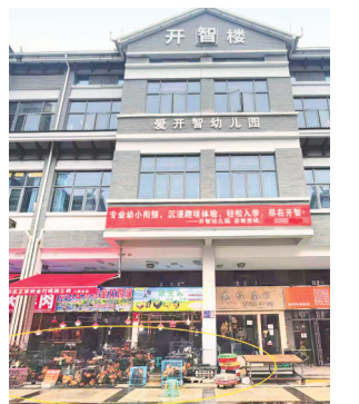
二楼是幼儿园，一楼是活禽店铺（画圈处）。

“若仍未完成整改，将由区农业农村局指导街道依法进行执法处理。”街道办工作人员表示，后续将持续跟进整改情况，确保问题得到有效解决。