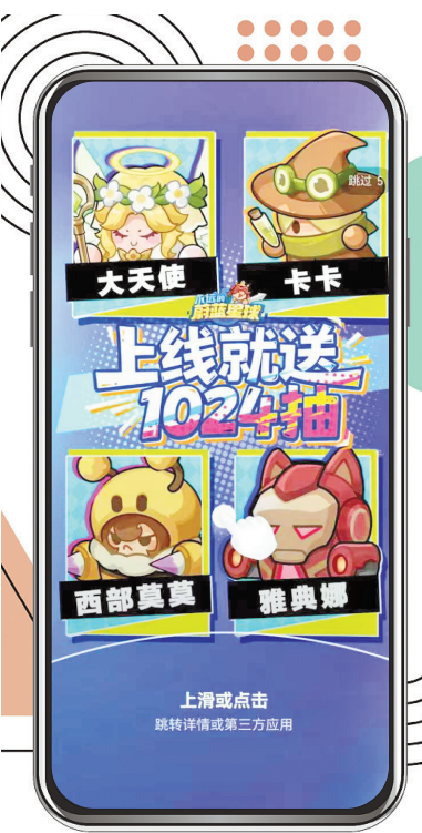
某些手机APP打开时弹出的广告。

贵州省通信管理局表示，将持续深化专项整治工作，压实APP运营者主体责任，推动行业生态不断净化，切实筑牢用户个人信息安全屏障，为广大用户营造更加规范有序的移动互联网应用服务环境。