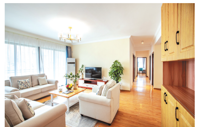
中天铭廷高级人才公寓。

“岗”的供给，以广阔舞台成就人才价值。人才因事业而聚，事业因人才而兴。贵阳贵安坚持以岗聚才、以业育才，持续拓宽岗位来源渠道。稳定机关事业单位、基层项目等公共部门岗位，综合运用财政补贴、税收优惠等涉企扶持政策支持民营企业稳岗扩岗，积极争取央属、省属企业在金融、电力、通讯、军民融合等领域的优质岗位资源。“十四五”期间，贵阳市累计为高校毕业生等群体提供就业岗位78.59万个，吸引57.27万名高校毕业生在筑就业创业，连续五年每年超10万名大学生选择扎根贵阳贵安。从通过筑梦驿站解决落脚难题，到在贵阳实现创业梦想，无数青年的奋斗故事在这片热土上书写，城市与人才双向奔赴的画卷徐徐展开。