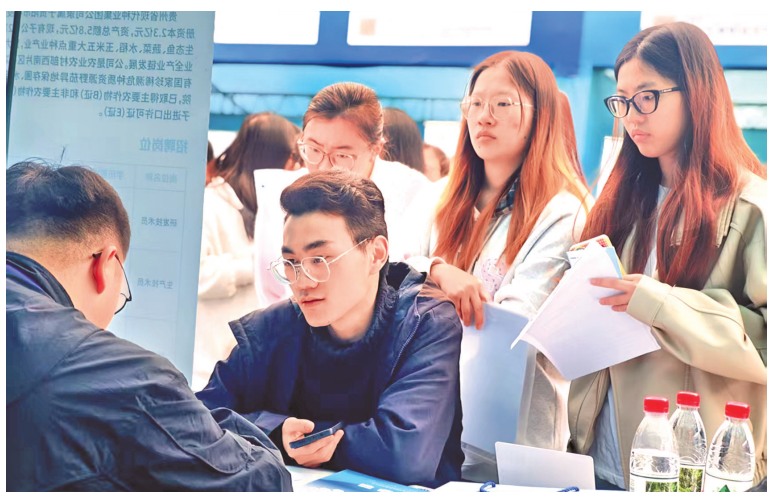
人才招聘会现场洽谈。

“十五五”时期，贵阳贵安将继续以“人才兴市”战略为统领，以优政策吸引人才、以好平台成就人才、以暖服务留住人才，让各类人才在筑城大地创新创业、安居乐业。广聚天下英才，汇聚黔进动能，贵阳贵安正以海纳百川的胸襟和真抓实干的担当，书写人才与城市双向奔赴、彼此成就的时代华章。