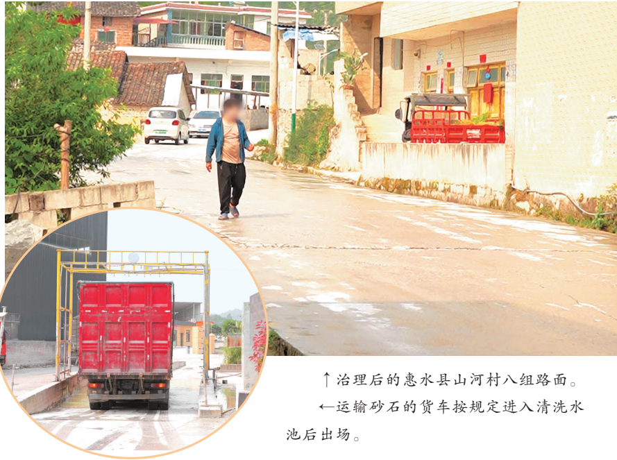
↑治理后的惠水县山河村八组路面。 ←运输砂石的货车按规定进入清洗水池后出场。

“天眼问政”栏目发布报道后，引起惠水县相关职能部门高度重视。4月15日，贵州惠水经济开发区、黔南州生态环境局惠水分局和惠水县工信局、住建局、应急管理局、交警大队、交通运输局、自然资源局等部门分别就整治工作作出回应，明确将通过联合执法等手段，开展扬尘专项整治，坚持路面执法与源头监管并重，重点查处运输车辆未密闭覆盖、车轮未冲洗及道路遗撒等行为，常态化督促该