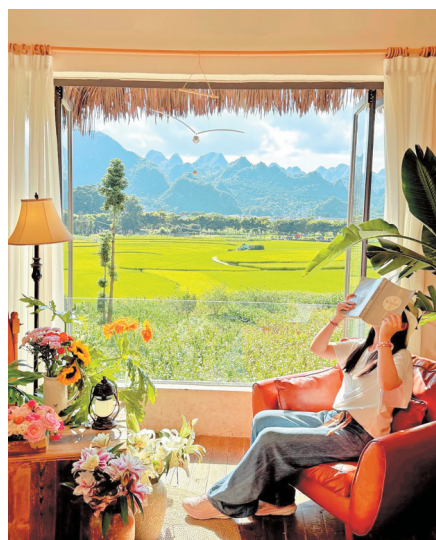
万峰林内非常出片的咖啡馆。

徐霞客当年被这片峰林震撼，今天的旅人则被这里的生活留住。时光荏苒，山水未变，人间烟火更暖。