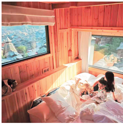
推窗见景的侗寨民宿。图源小红书网友@太普亚雅

沿着山路离开时，记者迎面遇上几位前来考察合作的旅行商。其中一位说，“五一”假期前后他们将组织多个团队前来。