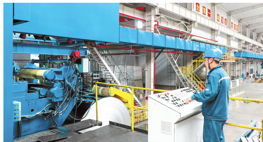
贵州铝基新材料有限公司的生产车间里，工人在操控设备。

如今，兴仁市构建起“煤发电—电炼铝—铝深加工”的完整链条。电解铝产能从2018年的25.28万吨跃升至48.88万吨，占贵州省电解铝总产能的28.16%。锚定“贵州铝都”目标，兴仁