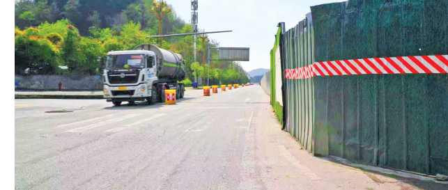
由于围挡的存在，反方向车道被改为双向通行。

云岩区住房和城乡建设局安监站一名工作人员表示，该围挡是为修建太金线项目而设置，后因项目资金问题停工，围挡内工程也随之停滞。至于太金线何时复工，该工作人员表示尚不清楚。