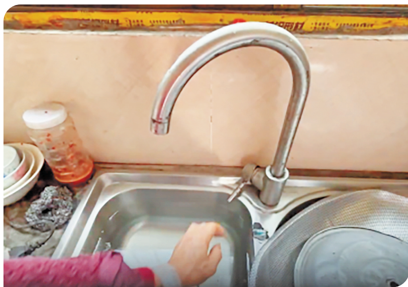
打开村民家中水龙头，并没有水流出。