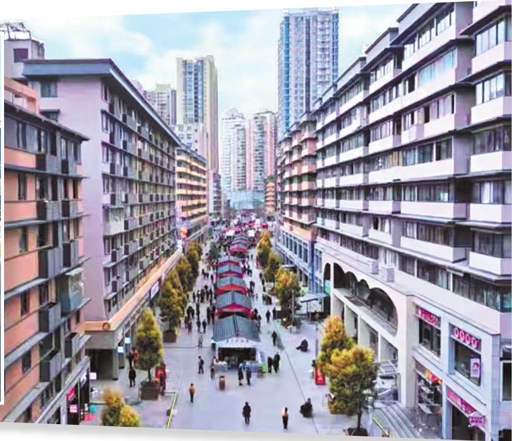
贵阳市青云市集一角。