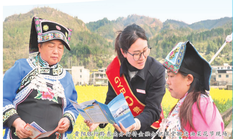
贵阳银行黔东南分行金融知识宣讲走进油菜花节现场。