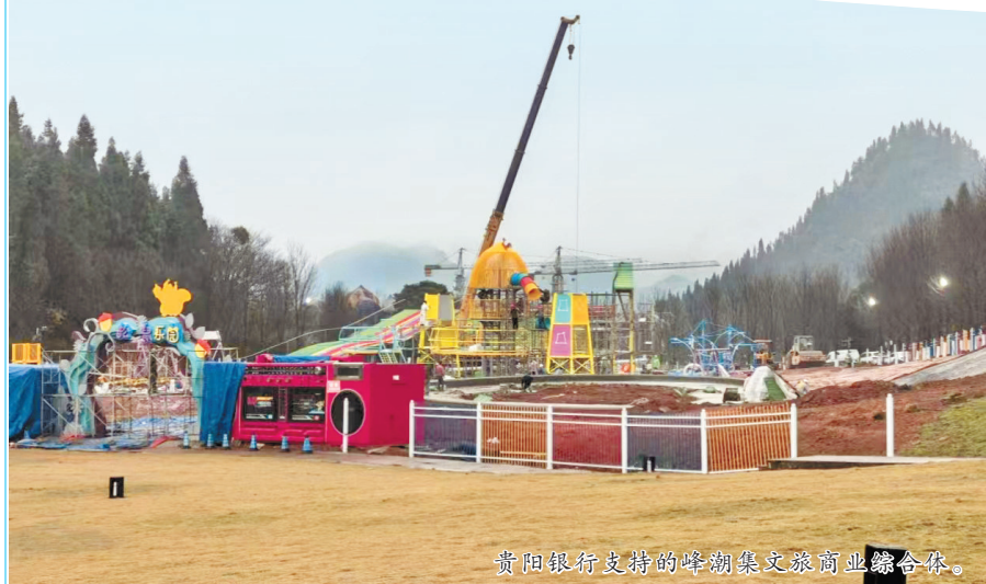
贵阳银行支持的峰潮集文旅商业综合体。