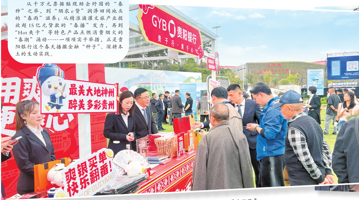
贵阳银行在贵州省第二十届旅发大会现场开展金融服务。

从千万元票据贴现助企纾困的“春耕”之举，到“烟农e贷”润泽田间地头的“春雨”滋养；从精准滴灌文旅产业投放超15亿元贷款的“春耕”发力，再到“Hot爽卡”等特色产品点燃消费烟火的“春耕”涌动……一项项实干举措，正是贵阳银行这个春天播撒金融“种子”、深耕本土的生动实践。