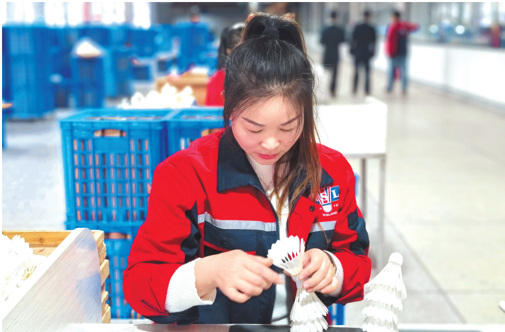
兴业、强县、富民的特色产业。

从基地散养的白鹅，到车间的羽毛球，锦屏县鹅产业已建成集养殖、加工、销售、餐饮、赛事于一体的全产业链，成为