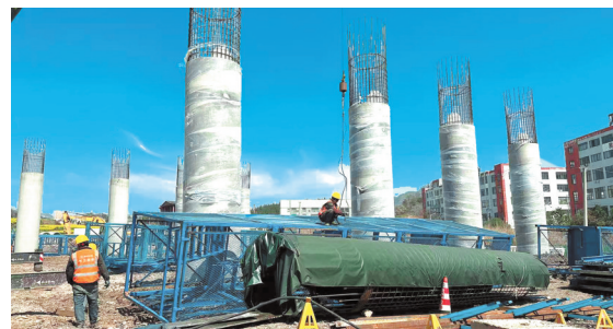
松万高速2标段锦江特大桥项目施工现场。

松万高速是《国家公路网规划》中G6512秀山至从江高速公路的重要组成部分，也是贵州省“678”高速公路网中“1纵”仅剩的两个未实施路段之一。项目起于松桃自治县大兴镇将军山枢纽，顺接已建G6512秀山至从江高速公路松桃至铜仁段，与杭瑞高速衔接，止于万山区龙生社区东侧，全长37.039公里，桥隧比28.8%，总投资70.33亿元，建设工期3年。