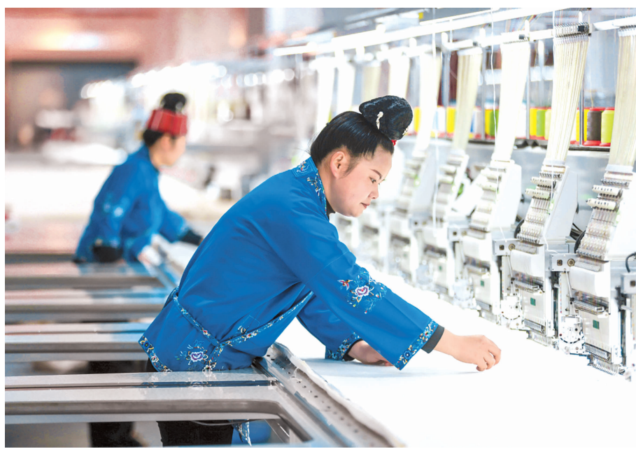
黔东南州施秉县舞水云台旅游商品开发有限公司破解传统非遗产业化难题，推动苗绣生产从传统手工向智能化跨越发展，带动当地群众家门口就业增收。图为3月25日，员工在赶制外贸订单。

套设施，安顺经开区杨湖豪庭旅居项目拥有了一批来自北京、上海、江苏、海南等地的“新市民”。 “夏季是省外客户置业的高峰期，需求最旺盛时一天可成交约8套房产。”