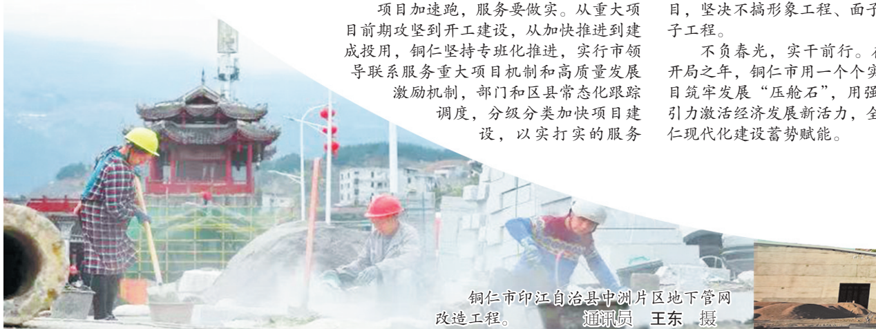
铜仁市印江自治县中洲片区地下管网改造工程。