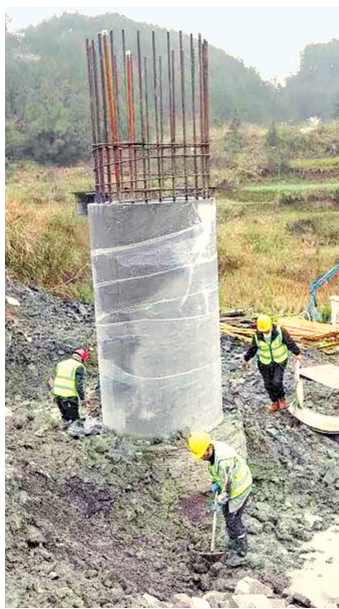
铜仁市印江自治县新寨镇龙井村移民集中安置项目施工现场。

本报讯（记者 蔡茜）3月25日，铜仁市花滩子水库附属工程印江自治县新寨镇龙井村移民集中安置项目施工现场，挖掘机、铲车等大型机械开足马力、有序作业。