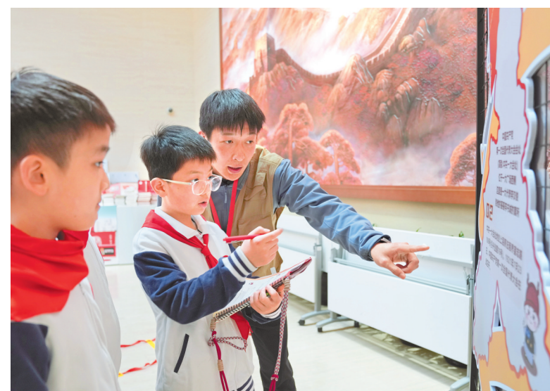
3月30日，“树德课堂·黄浦区红色周一大思政课”小学版课程在上海中共一大纪念馆正式开课。黄浦区卢湾一小的师生们走进纪念馆展厅，开启沉浸式学习实践。“周一大思政课”由中共一大纪念馆与上海市黄浦区教育局联合开发，面向不同学段，分层分类推进。学校利用每周一次的闭馆日，将课堂搬进展厅，将红色资源转化为育人教材，让青少年在实践中感受信仰力量。因为在纪念馆里，老师指导学生完成打卡闯关任务。

新华社北京3月30日电 记者从世界数据组织筹备委员会获悉，世界数据组织30日在北京成立。组织的成立旨在推动全球数据发展与治理实践，促进数据在合规、安全、可信前提下交流与利用，服务全球数字经济高质量发展。据世界数据组织秘书长杨杰介绍，世界数据组织的宗旨是“弥合数据鸿沟、释放数据价值、繁荣数字经济”。通过促进能力建设、规则交流、技术协同和产业合作，帮助更多国家和群体更好获取、使用和保护数据资源；通过提升数据流通和开发利用效率，促进数据从“资源”转化为“价值”；通过推动数据技术、规则和产业生态协同，服务数字经济持续健康发展。联合国科学与技术促进发展委员会主席、联合国数据治理工作组副主席穆科德表示，世界数据组织的成立恰逢其时，不可或缺。世界数据组织让每个国家都能真正参与全球数据治理决策。杨杰表示，世界数据组织愿意与包括国际电信联盟(ITU)、世界知识产权组织(WIPO)等相关国际组织通力合作，共同推动全球数据合作从规则讨论走向标准衔接、场景落地和普惠发展。世界数据组织成立宣言也于当日发布。据了解，世界数据组织是由全球数据领域相关单位及个人自愿结成的专业性、非政府、非营利性国际团体。组织将为全球数据合作提供一个面向实践、面向行业、面向多元主体的对话与协作平台。