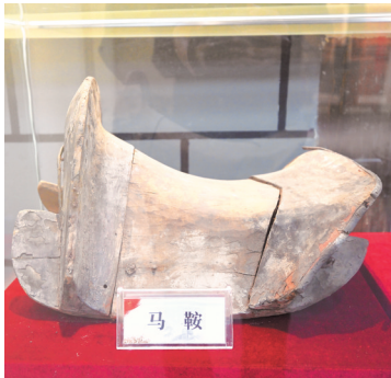
红军马鞍（复制品）。

2022年，威舍红军长征陈列馆开始筹建，为了让更多人了解这段历史，余伦启毅然决定将红军马鞍无偿捐献。如今，这副马鞍已成为该馆的镇馆之宝。“我把马鞍交给政府保管，是希望它能得到更好的保护，向更多人讲述红军故事。”余伦启说。