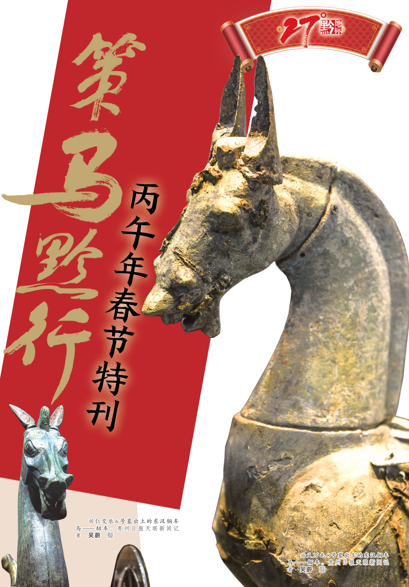
兴仁交乐6号墓出土的东汉铜车马——轺车。

1935年4月，红军长征途中，红一、红三军团经过底窝并曾住在马头寨等地，司令部也曾驻在马头寨宋家祠堂，留下了红军标语等革命文化遗迹，为马头寨增添了红色印记。