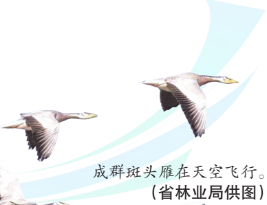
成群斑头雁在天空飞行。

今年越冬季，红枫湖水鸟种群数量较往年同期稳中有增：绿翅鸭超300只、斑嘴鸭超250只、赤膀鸭超140只；国家二级保护动物黑颈鸬鹚数量逾百只；部分斑嘴鸭、黑水鸡更是由冬候鸟变成了留鸟——翅膀的选择，从不撒慌。迁徙的候鸟用年复一年的“赴约”，为贵州生态治理投下最坚定的信任票。