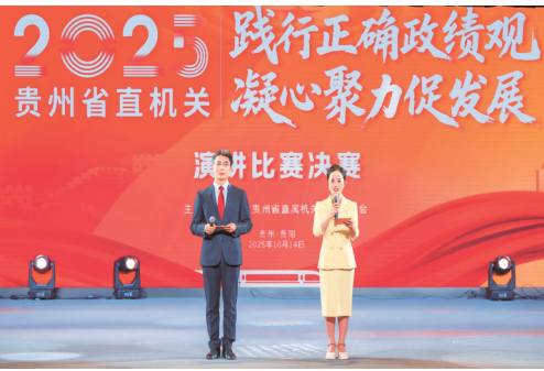
2025年，省直机关工委以“践行正确政绩观 凝心聚力促发展”为主题开展演讲比赛。