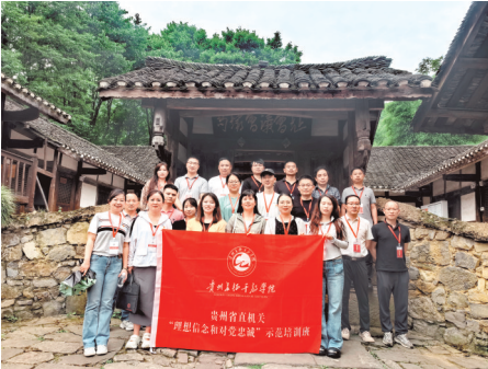
省直机关工委依托党员教育基地持续开展党性教育，大力实施党员干部政治能力提升行动。

实施抓党建促发展质量提升行动，完善党建和业务融合发展高效运行机制，切实把机关党建的政治优势、组织优势转化为推进中国式现代化贵州实践的工作优势、发展优势。