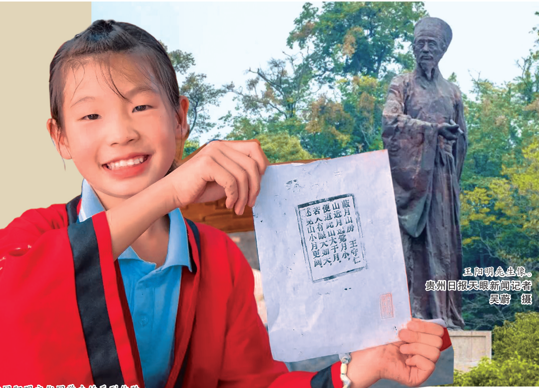
中国阳明文化园举办的系列体验活动。

2026年，贵州将持续深耕“四大文化工程”，高位推进长征国家文化公园贵州重点建设区、长江国家文化公园贵州段建设，精心筹备举办纪念红军长征胜利90周年系列活动，让红色基因代代相传。聚焦文物普查与活化利用，强化民族特色村寨、传统村落、历史文化名村名镇及红色旧址系统性保护，守好文化根脉。深入实施文化惠民工程，聚力精品创作生产，办好多彩贵州文化艺术节，深化文旅体融合发展，繁荣互联网条件下新大众文艺，让文化发展成果惠及更多群众。