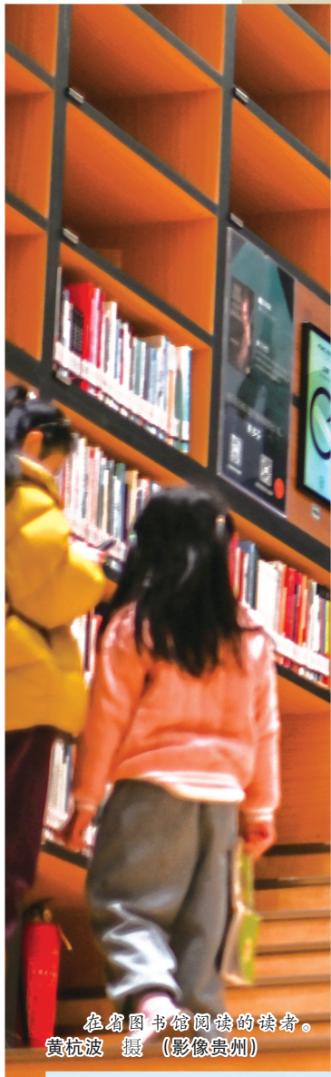
在省图书馆阅读的读者。

彭银表示，省图书馆围绕群众需求，以创新服务模式和数字化手段，将优质文化资源精准输送至社区、乡村，不断提升基层公共文化服务水平。