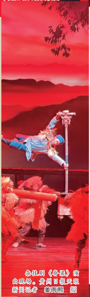
杂技剧《脊梁》演出现场。

陆水莲表示，杂技作为一门具有开放性的艺术门类，是向世界展示贵州的绝佳载体。杂技剧《脊梁》已赴瑞典、法国等欧洲国家巡演，讲述了贵州从“地无三里平”到“高速平原”的奋斗故事。未来，还将优化国际版杂技剧《白云深处有人家》，出国巡演。