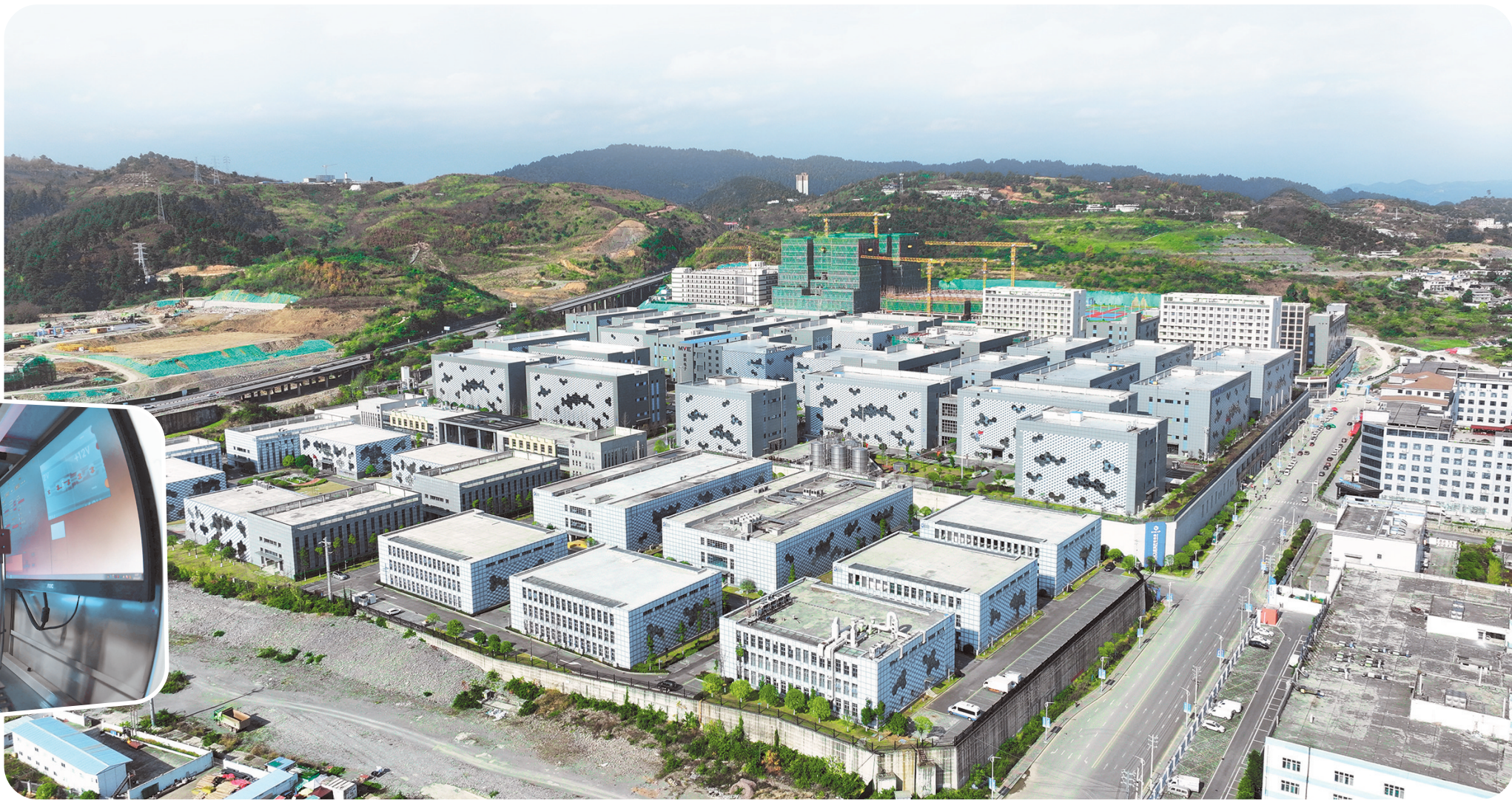
贵阳市南明智能制造产业园。