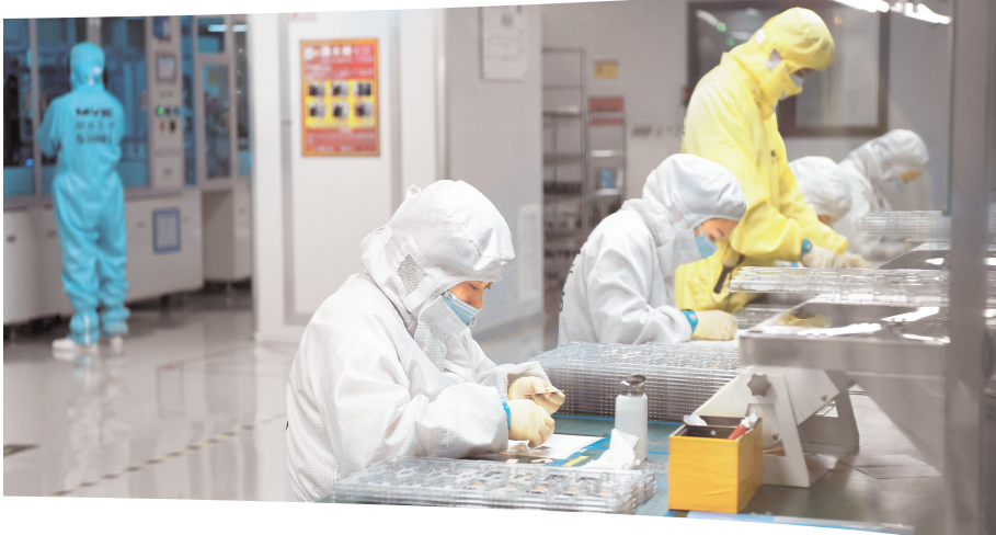
联积电子(贵州)有限公司品检员抽检产品。