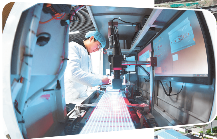
贵州辉煌电子产业投资有限公司的技术人员检测与组装微电子元件。

成绩的背后，既是全省以机制创新破解招商引资“合力不足”难题的系统性实践，也是全省锚定“大抓产业、大抓项目、大抓招商”目标，推动经济高质量发展的生动注脚。