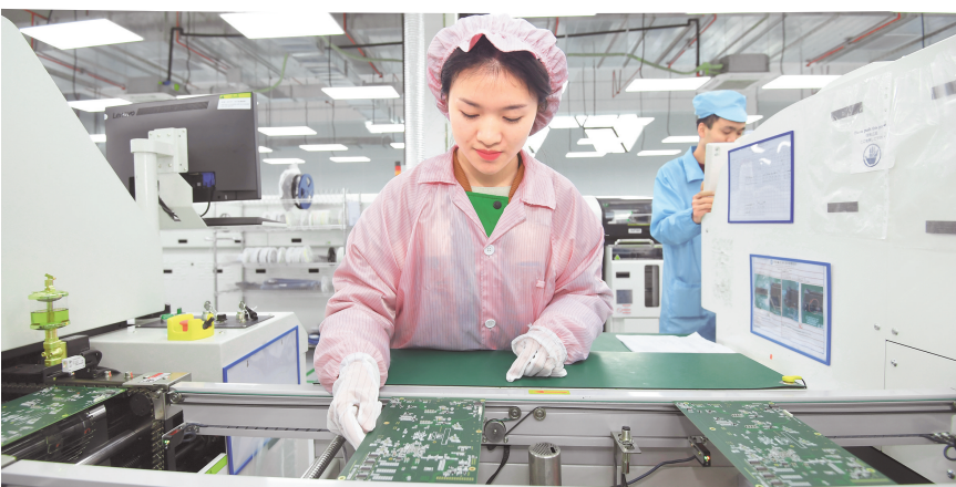
贵阳臻芯科技有限公司的IPQC巡检员正在巡检。