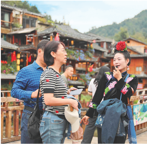
西江千户苗寨导游在向游客作介绍。 吴贤燕 摄（影像贵州）