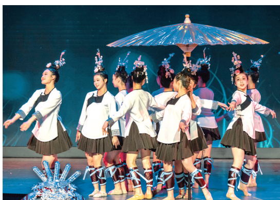
↑歌剧《屯堡长歌》选段《故土难离》。 ←民歌联唱表演者。