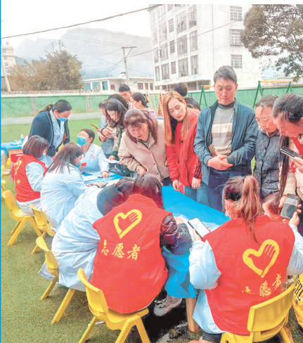
六盘水水城区玉舍镇卫生院入村宣传肺结核相关知识。