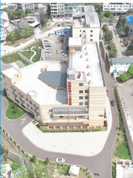
水城区第二人民医院。