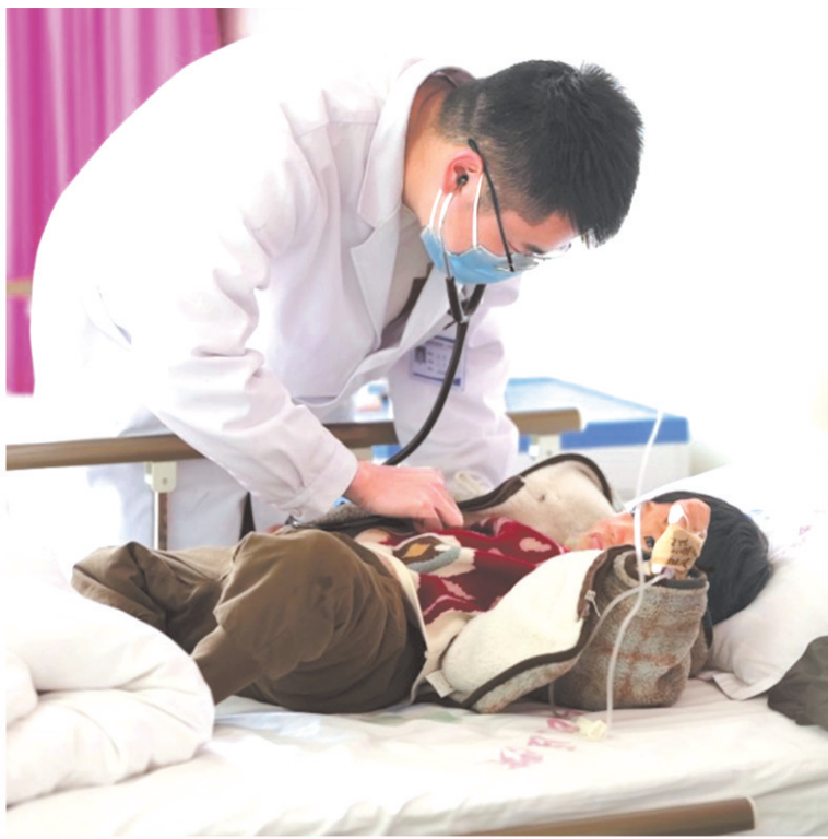
水城区第二人民医院医生为患儿诊治。