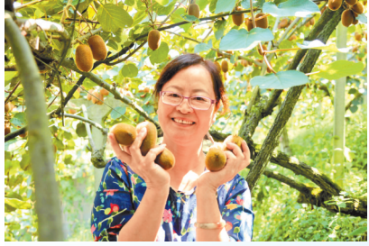
在谷堡镇平滩村，游客展示采摘的猕猴桃。