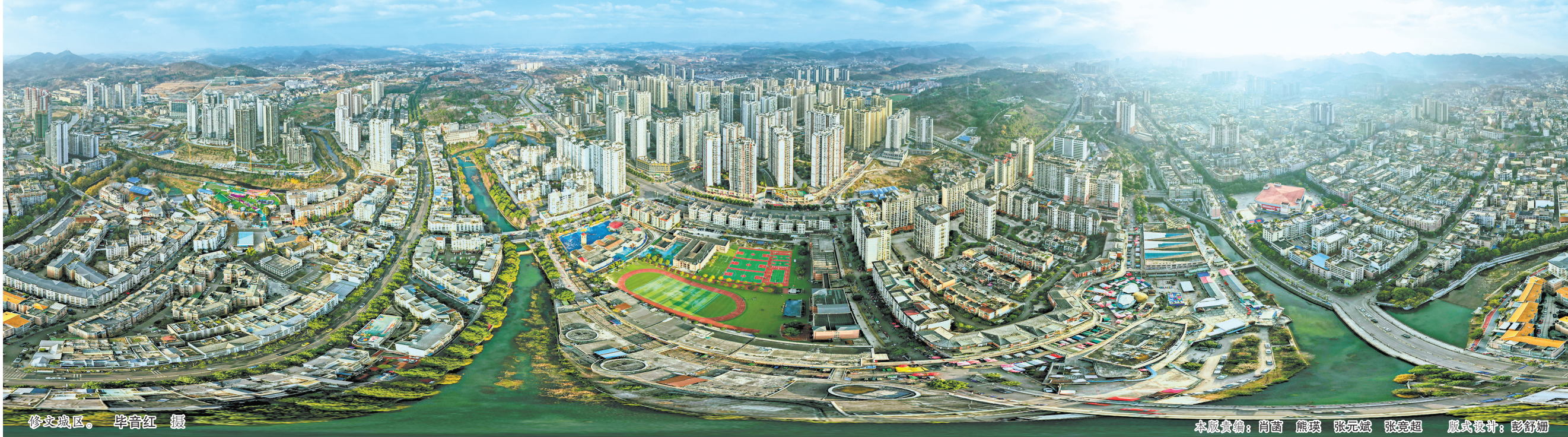
修文城区。