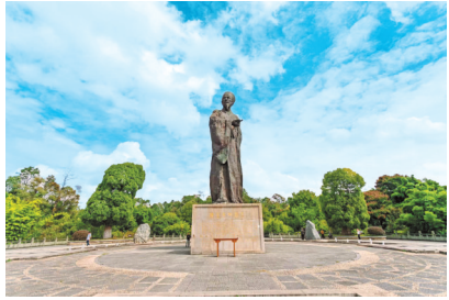
中国阳明文化园亲民台。