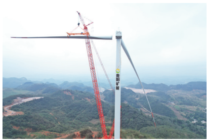
高仓风电场。