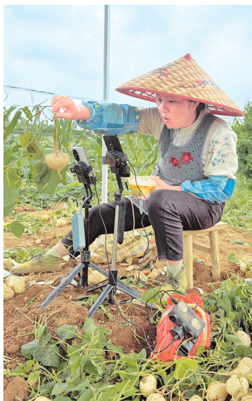
村民在田间地头直播带货。