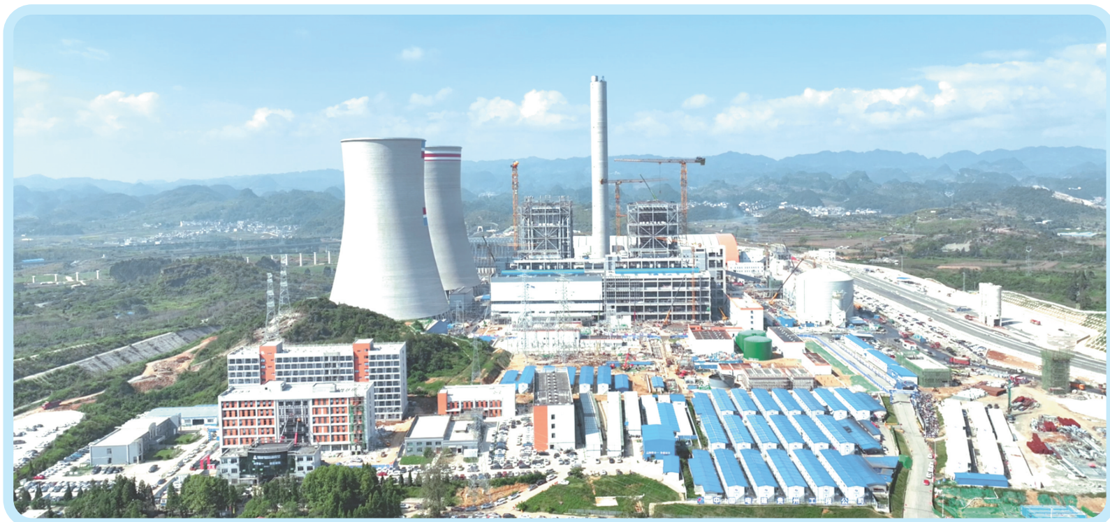
盘江普定2×66万千瓦燃煤发电项目。

寒冬时节，普定经开区处处涌动生产热潮，能源企业稳产保供劲头十足，产业链联动发展态势向好，尽显蓬勃生机。