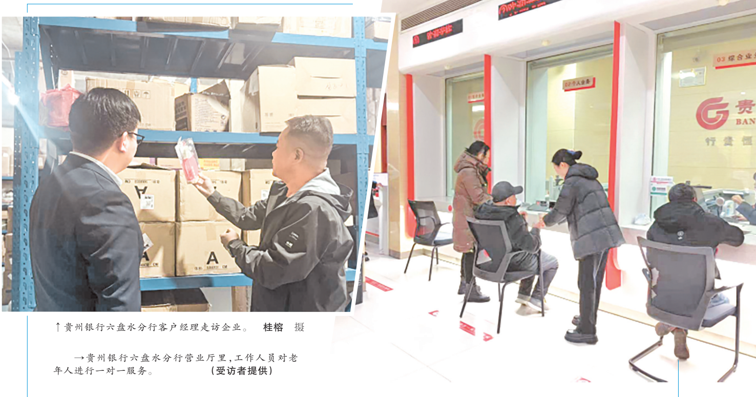
↑贵州银行六盘水分行客户经理走访企业。桂榕 摄