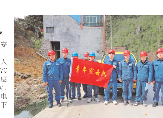
南方电网贵州安顺紫云供电局青年突击队。

厘清惠民“一本账”。该镇统一配发网格员工作日志，内含网格员和网格工作职责清单，便于网格员记录日常走访、巡查与服务情况，并对发现的问题及处理结果进行闭环登记，以一本日志明晰“条条规定”推动“一事一记”，最终实现民情全掌